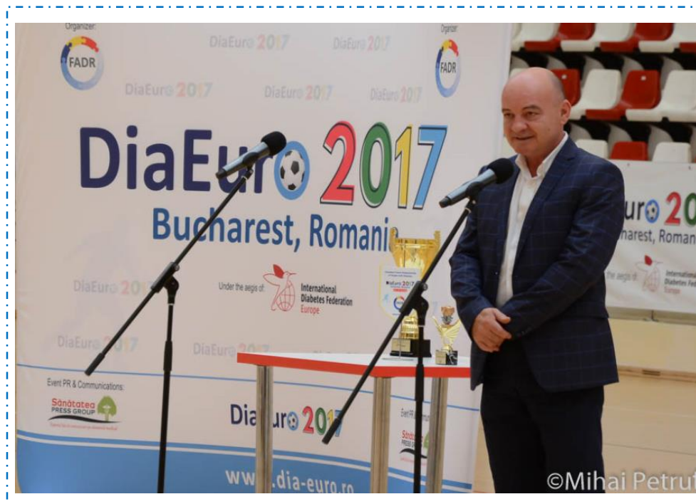
Mihai Mugur Toader, Primarul Sectorului 2 București