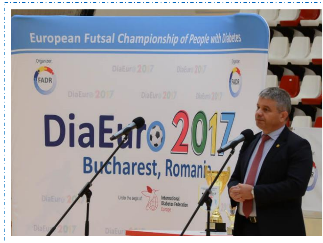
Prof. dr. Florian Bodog, Ministrul Sănătății